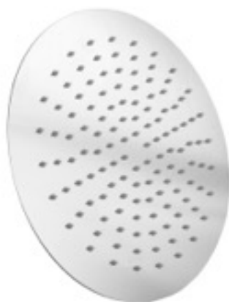
DURCHFLUSS (L / MIN)